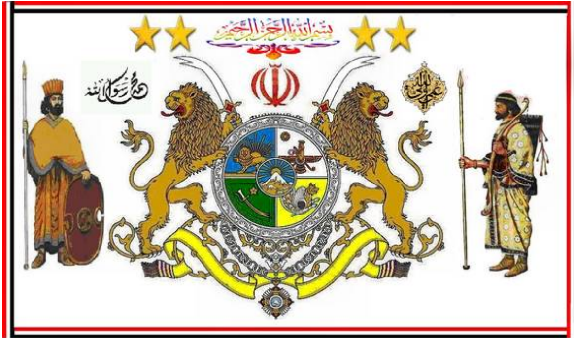
نشان ملی اتحاد سرزمینهای ایرانی